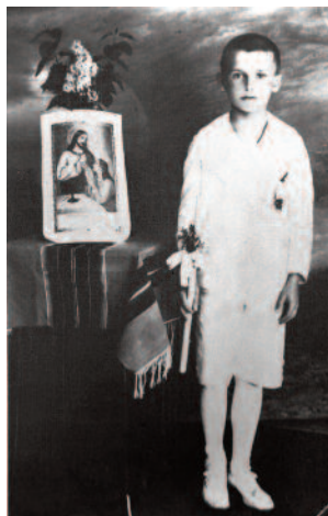
Szent II. János Pál pápa elsőáldozási fotója

Az elsőáldozás napja azonkívül nagy ünnep a plébánián is. Mintha ma lenne, úgy emlékszem a napra, amikor velem egykorú társaimmal először áldoztam falum plébánia-templomában. Az eseményt családi fotókon szokták megörökíteni, nehogy feledésbe merüljön. Az ilyen pillanatokról készült főlvételek általában elkísérik az embert élete további részében. Amikor időnként előkerülnek a fényképalbumok, ismét megelevenedik azoknak a pillanatoknak a légköre; az ember újra földézi azt a tisztaságot és örömet, melyet azzal a Jézussal való találkozásban élt át, aki szeretetből lett az ember Megváltója.