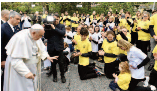
Előre nem tervezett találkozás egy budapesti utcán éneklő, fiatalokból álló csoporttal.

vagyunk, miközben távol tartjuk Istent a szívüktől, amely önmagukkal van tele. A kenyérszaporítás csodájához éppen elegendő volt, hogy volt egy fiú öt kenyérral és két hallal, aki Jézus kezébe helyezte azokat. Nekünk is csak ennyit kell tennünk: odaadni neki, amink van, bűneinket, nyomorúságainkat.